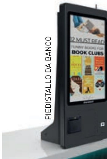
PIEDISTALLO DA BANCO