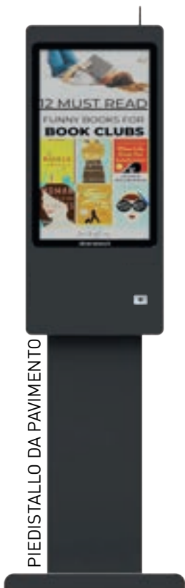
PIEDISTALLO DA PAVIMENTO