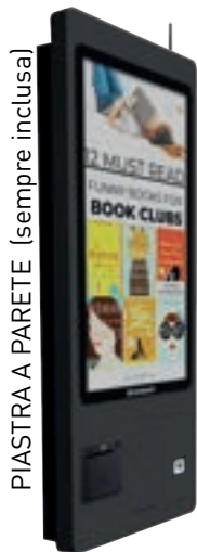
PIASTRA PARETE (sempre inclusa)

Kiosk NON FISCALE : per ordini, gestione file e advertising