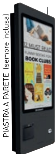
PIASTRA PARETE (sempre inclusa)

Kiosk NON FISCALE : per ordini, gestione file e advertising