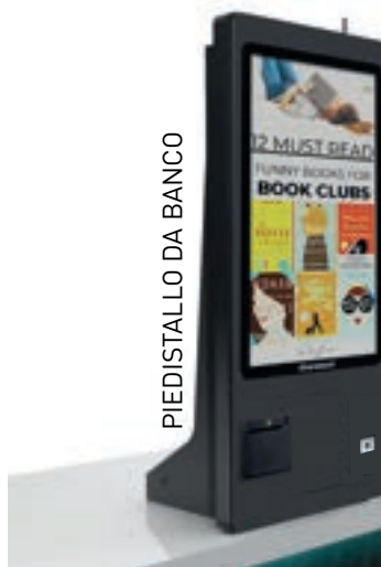
PIEDISTALLO DA BANCO