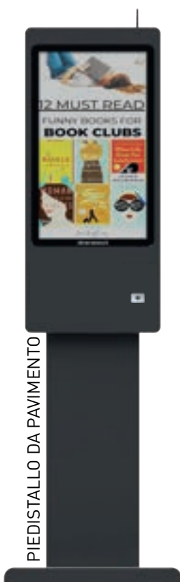
PIEDISTALLO DA PAVIMENTO