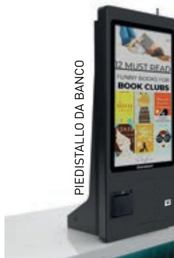
PIEDISTALLO DA BANCO